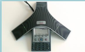
3 témoins lumineux verts