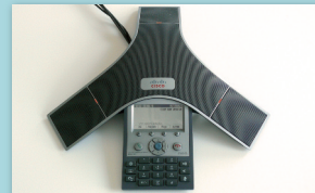
3 témoins lumineux rouges